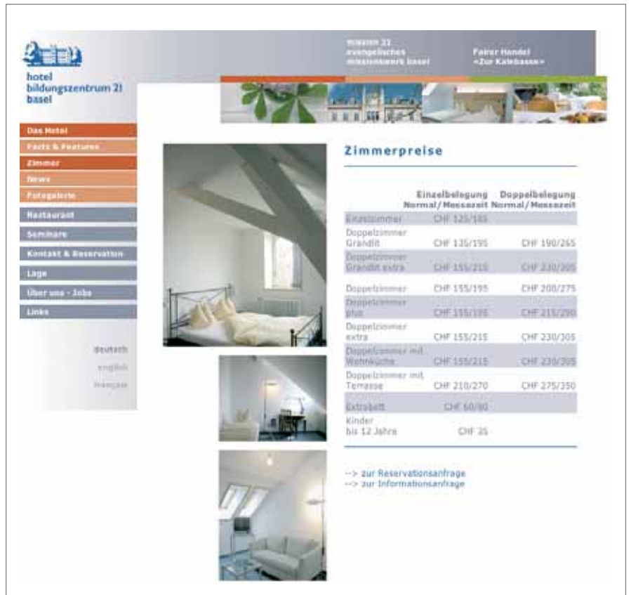
Hotel Bildungszentrum 21 ( www.bildungszentrum-21.ch )