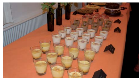
Die Krönung war das Dessertbuffet. Es blieb fast nichts übrig.