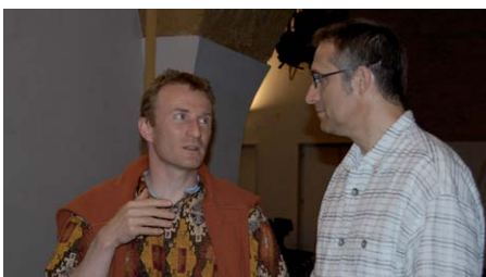
Erste Kontakte wurden bereits beim Apéro geknüpft.

DropNet AG freut sich auf die nächsten 10 Jahre und ist gespannt, was die Zukunft bringt. Bestimmt verbinden uns