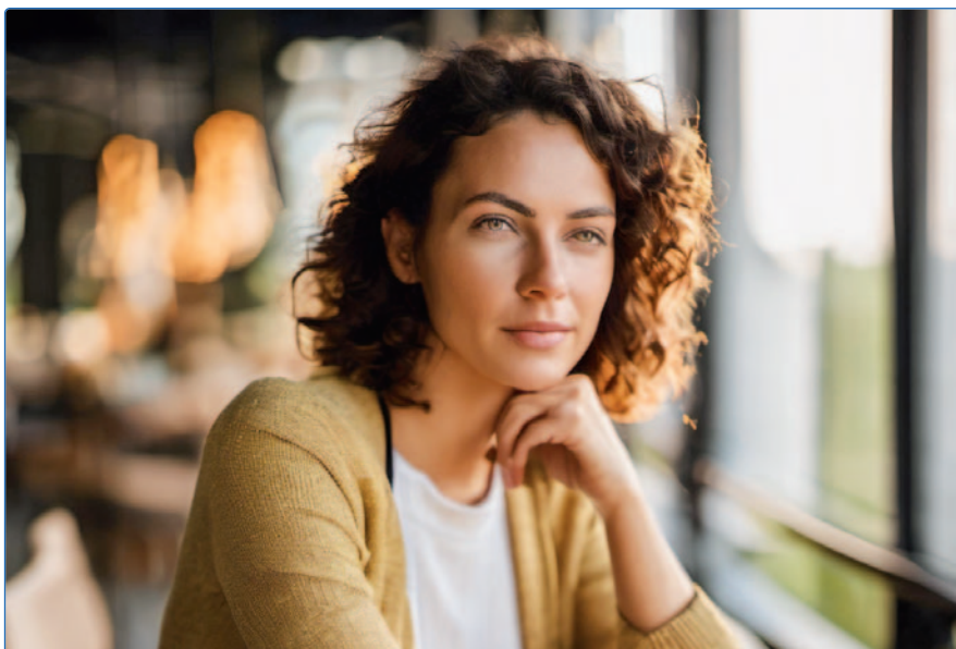
Ein mit künstlicher Intelligenz erstelltes Bild

Der Dienst ChatGPT von OpenAI hat garantiert jeden, der ihn das erste Mal einsetzte, ins Staunen versetzt. Das Sprachverständnis ist unterdessen gewaltig und das Know-How auch. Er weiss zu fast jedem Thema etwas und liefert sogar Beispiele. Wird er den Menschen ersetzen oder ist er einfach ein weiteres Werkzeug, so wie damals der Taschenrechner die Welt revolutionierte? Als Informationsquelle und Texter hat sich ChatGPT bereits in vielen Branchen etabliert.